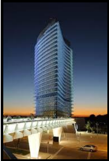
Torre del Agua

EXPOSICION INTERNACIONAL DE ZARAGOZA 2008: Es el espacio donde se encuentra situado el Acuario fluvial de Zaragoza lugar de celebración de la XXI Convención de la SEK.